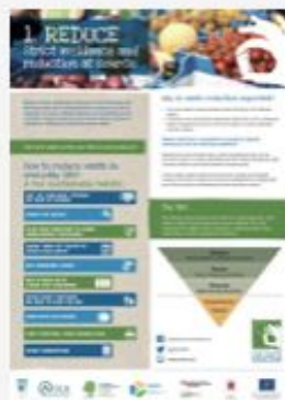
Reduce, Reuse, Recycle panels

Scarica il kit di comunicazione (logo, poster, strumenti web, materiali informativi) dal sito europeo, QUI :